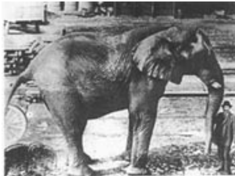
LES REINES PROCHAINES ENTPROCHAINISIERT